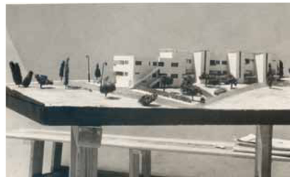
Modell eines Mehrfamilienhauses in Jerusalem im Auftrag der muslimischen Waqf, 1937