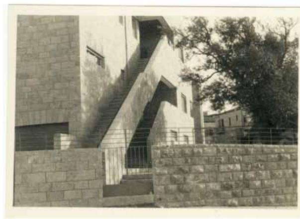
Mehrfamilienhaus der muslimischen Waqf in Jerusalem, 1937