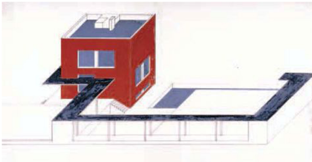
Farkas Molnar, Crvena kocka, 1923.

i slabosti, i daju jasniji odraz slike društva dovedenog do doslovnog ruba.