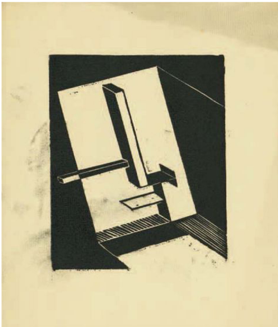
Farkas Molnar, Arhitektonska fantazija , 1923.

Knjiga Bauhaus osobno: Zbirka Marie-Luise Bethheim Weimar – Zagreb predstavlja iznimno vrijednu likovnu i dokumentarnu građu sačuvanu upravo u Zagrebu. U ovoj knjizi o Bauhausu se govori na jedan drugačiji, osobni način, koji svojim pristupom intrigira i inspirira te otkriva mnoge dosad nepoznate aspekte života na Bauhausu.