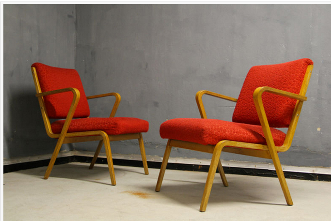
Stolice Selmana Selmanagića iz 1939. koje se prodaju danas na aukcijama