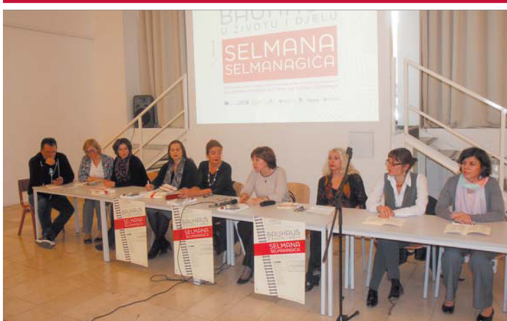
Značajan iskorak u evropske naučne tokove

Bauhaus Networking Ideas and Practice Umrežavanje ideja i prakse