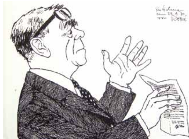
9. Selman Selmanagić, crtež Paul Rosie 1970. godine, Bauhaus-Archiv, Museum für Gestaltung, Berlin

U prvim poslijeratnim mjesecima Selmanagić je sudjelovao i u obnovi pojedinih dijelova Humboldt Univerziteta, ponajprije u dizajniranju imobilija kao što