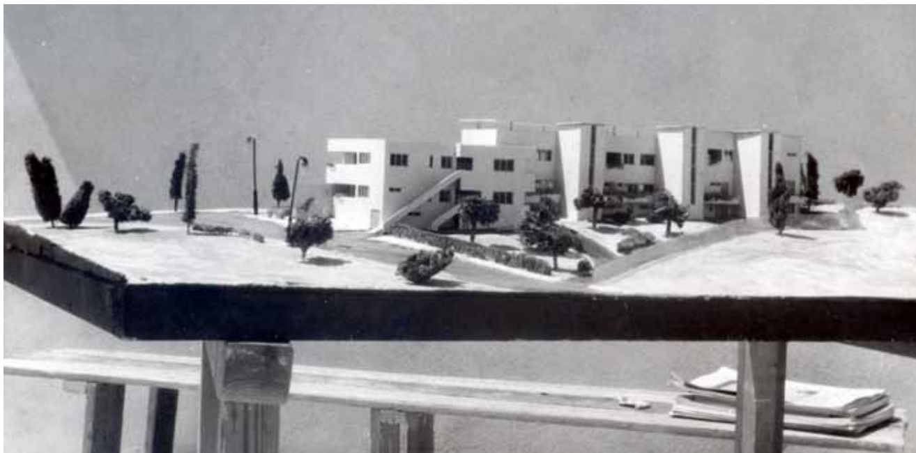
4. Model kuće za više obitelji u Jeruzalemu 1937. Model of a house for more than one Jerusalem family in 1937

ranijeg afiniteta prema predavanjima Kandinskog i Kleea, Selmanagićev funkcionalizam nije u konačnici bio jednostran, utilitaristički program, već prije metoda koja je upućivala upravo na ključnu funkciju sinestetičkih doživljajnih elemenata pri percepciji i oblikovanju. Na temelju predavanja profesora Dürckheima i njegova učenja o „ doživljenom prostoru ”, Selmanagić je trajno usvojio značaj činjenice o jedinstvu naših doživljaja u percepciji određenog prostora i značaj primjene tog iskustva u budućim projektima planiranja i oblikovanja. 27