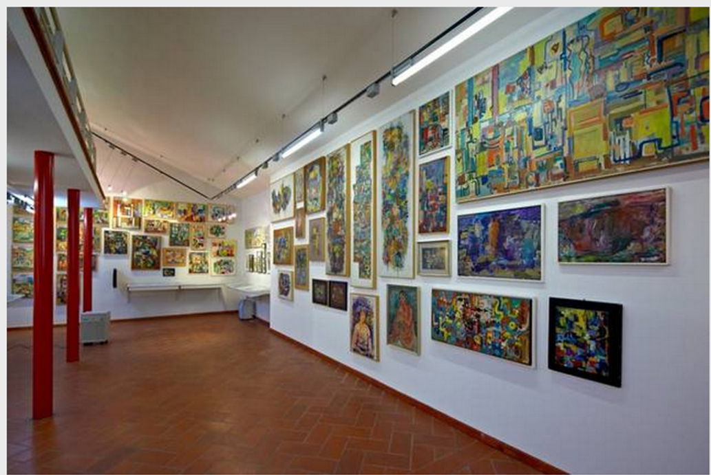
Galerija Avgusta Černigoja v Lipici.

Ključne besede: Avgust Černigoj, Kobilarna Lipica, Loški muzej, digitalizacija