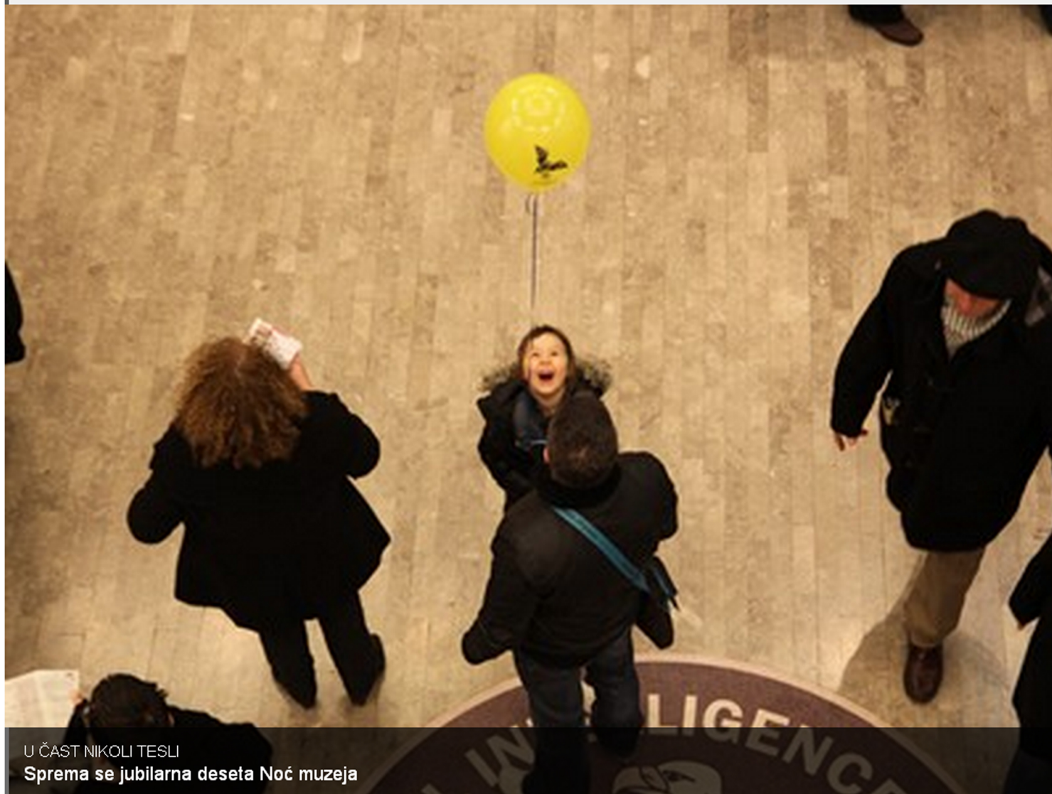
U ČAST NIKOLI TESLI Sprema se jubilarna deseta Noć muzeja