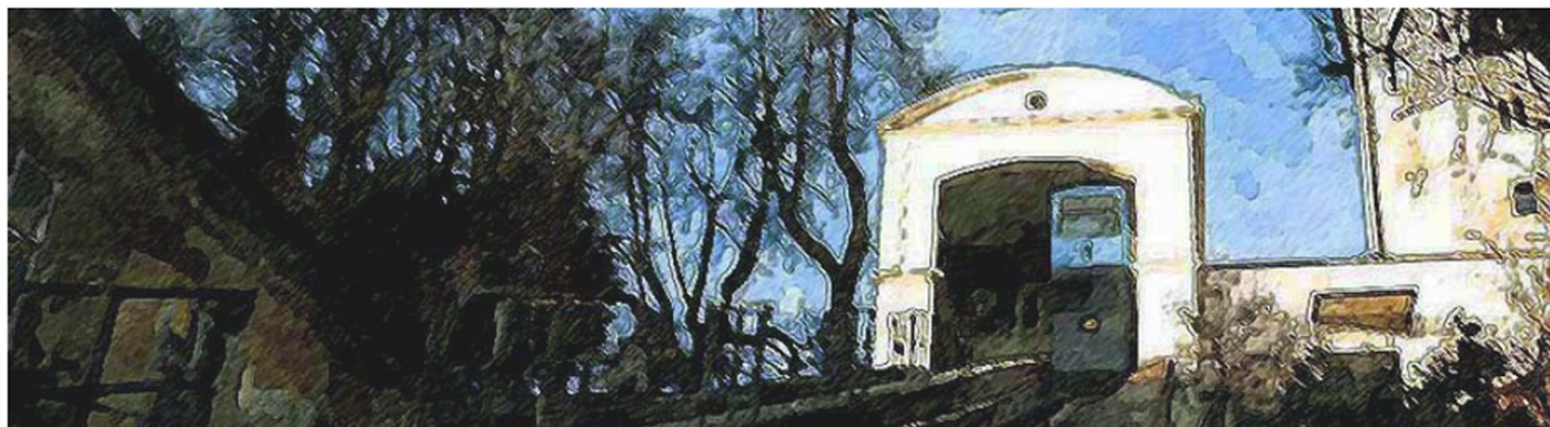
27. TRAVANJ 2015 BY KRESIMIRAG