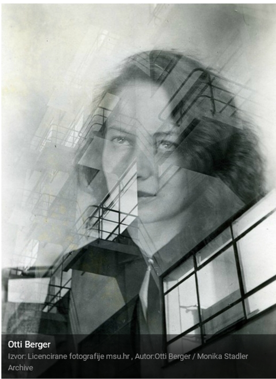
Otti Berger Izvor: Licencirane fotografije msu.hr, Autor: Otti Berger / Monika Stadler Archive

Izložba 'Bauhaus – umrežavanje ideja i prakse' (BAUNET), koja predstavlja opuse umjetnika arhitekata i dizajnera koji su se školovali na najutjecajnijoj međunarodnoj školi Bauhausu, a potječu iz Hrvatske i regije, otvara se na Dan Europe, 9. svibnja u Muzeju suvremene umjetnosti