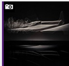
LUMINOKINETIČKA Nagrada publike T-HT Vesni Rohaček i Dori Đurkesac za