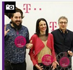
SUVREMENA UMJETNOST Nagrađeni najbolji na izložbi T-HTnagrada@msu.hr