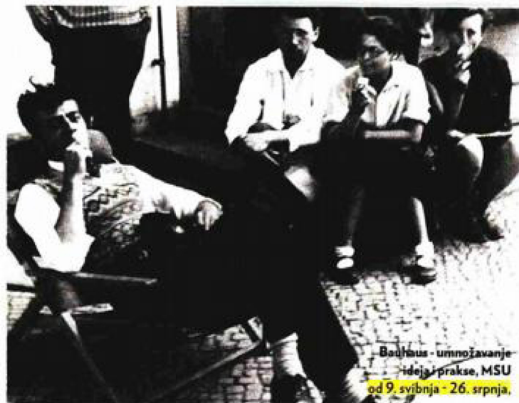
Bauhaus - umnožavanje ideja i prakse, MSU od 9. svibnja - 26. srpnja.