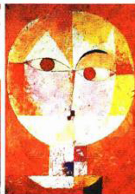
Kubistički portret žene Paula Kleea iz perioda Bauhausa