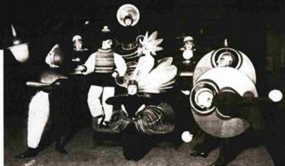
Čitava postava trijadnog baleta na premijeri u Stuttgartu