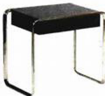
Poznati stolac koji je dizajnirao osnivač Bauhausa Walter Gropius

Raditi korisne stvari, od stolaca do trafostanica, i to što je više moguće na umjetnički način, ideja je koju su prihvatili brojni nadareni daci Bauhausa i njihovih sljednika u povijesti. Izložba u MSU do 27. će srpnja pokazat ne samo tko su nego i kako su radili, u svojim pratećim programima.