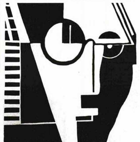
Portret pjesnika Srećka Kosovela autora Augusta Černigoja

1961. i pada Berlinskoga zida, kako bismo shvatili sve utjecaje vizionarske Bauhausove polazne ideje. Odnosi se to i na naš čuveni Exat 51 i njegov lančani utjecaj na suvremenu hrvatsku umjetnost i dizajn.