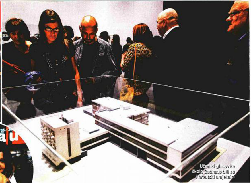
Učenici glasovite škole Bauhaus bili su i hrvatski umjetnici