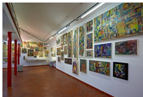
Avgust Černigoj bo poslej tudi digitalen