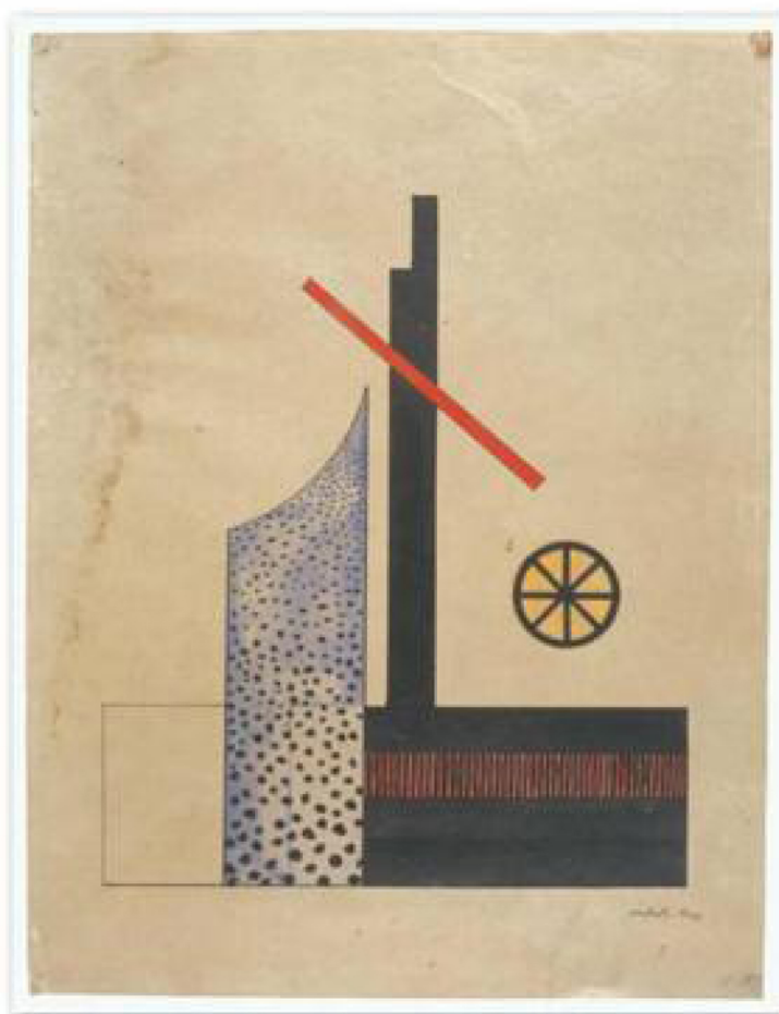
Letak povodom izgradnje nove zgrade škole u Dessau, 1926.