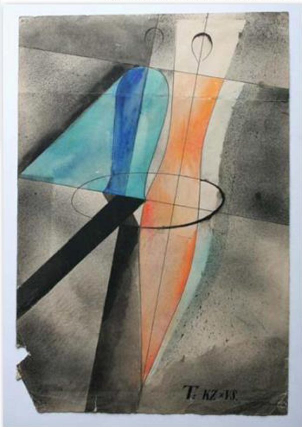
Farkas Molnár, Dvije figure, 1923.

kada su po osnivanju škole Bauhaus u Weimaru studenti i profesori organizirali svečanosti za koje su izrađivali zmajeve.