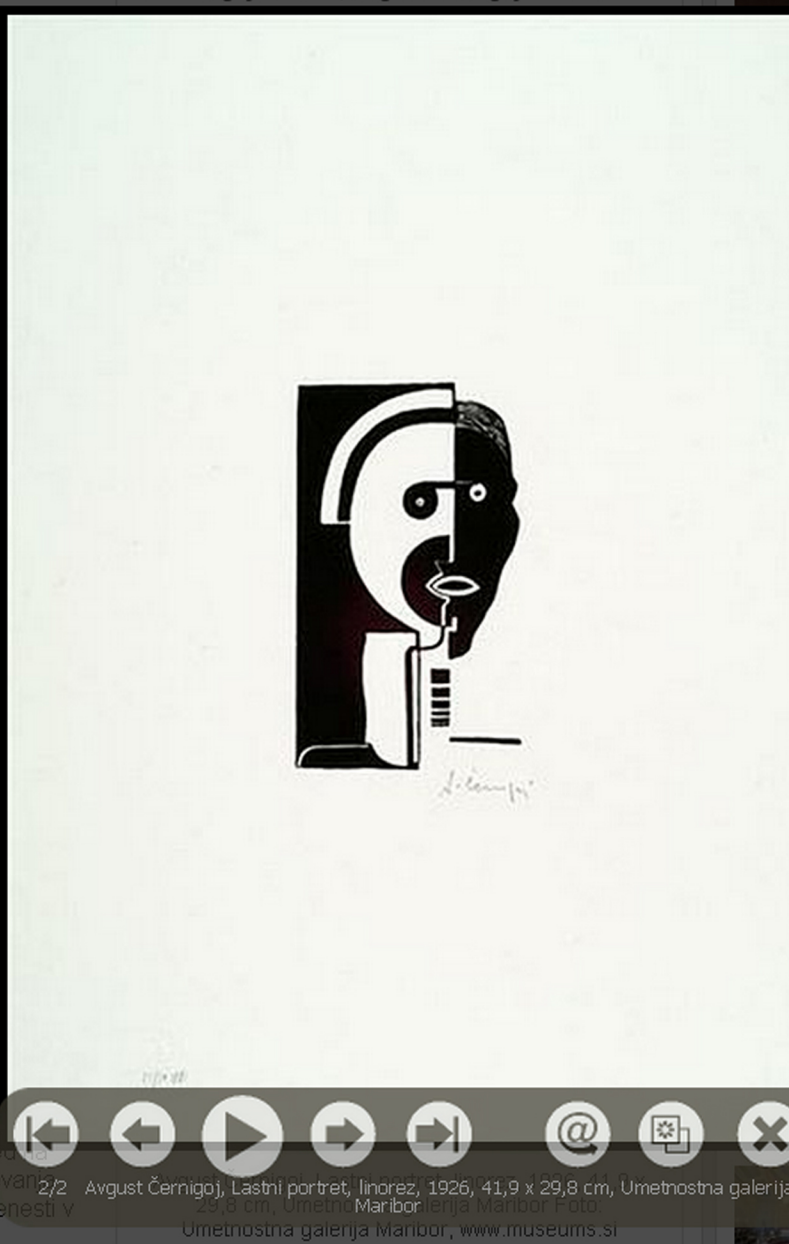
2/2 Avgust Černigoj, Lastni portret, linorez, 1926, 41,9 x 29,8 cm, Umetnostna galerija Maribor, www.museum.si

• Černigoj / Teater, Avgust Černigoj - v mreži