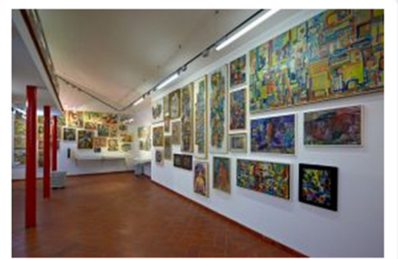
Weimar je bil stičišče najradikalnejših, sodobnih umetniških praks, ki so bile vezane tudi na pogled na družbo, v smislu demokratizacije družbe in združevanja umetnosti ter življenja. Černigoj je ideje skušal prenesti v naš prostor, ki pa zanje še ni bil zrel.

Ocena novice: ★★★★★ Vaša ocena: ★★★★★ Ocena 2.7 od 3 glasov Ocenite to novico!