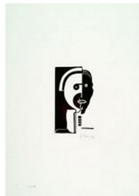
Avgust Černigoj, Lastni portret, linorez, 1926, 41,9 x 29,8 cm, Umetnostna galerija Maribor

Razstava, ob kateri sta izšla tudi katalog in zbornik prispevkov lanskega simpozija o Černigoju, nosi naslov Černigoj / Theater in jo bodo na Loškem gradu odprli drevi ob 20. uri. Osredotoča se na Černigojevo najplodovitejše in prevratno, zgodnje konstruktivistično obdobje, ko je ustvarjal gledališko kostumografijo in scenografijo ter večino drugih vrhunskih del, s katerimi se je dokončno zapisal tudi na evropski umetnostni zemljevid.